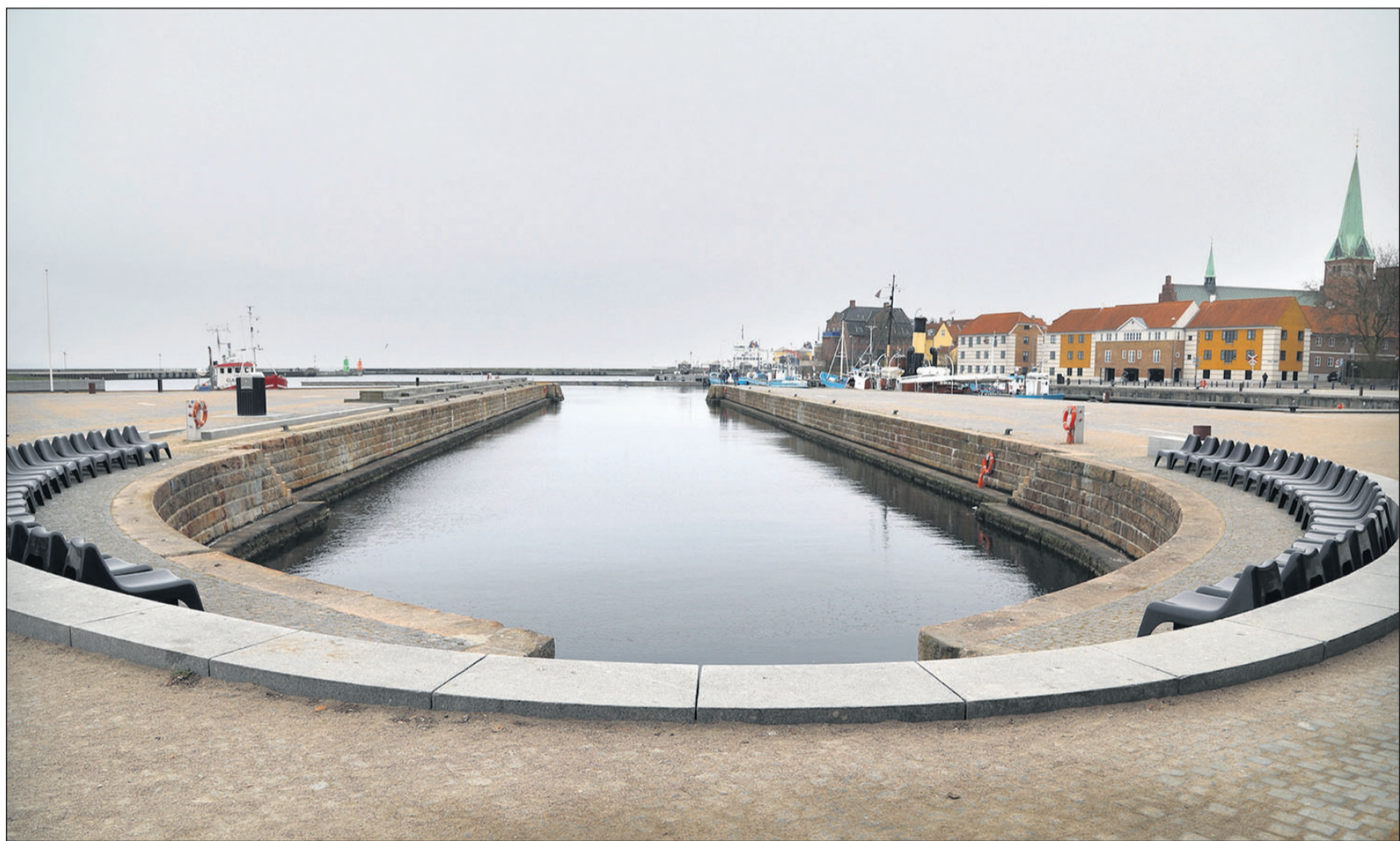
Dok 2 set fra Kulturværftet. Nye træbroer skal etableres, så museumsskibene kan komme til at ligge sikkert i dokken.

Hvis den sidste del af planlægning og aftaler falder på plads, så er man i Helsingør klar til at gå i gang med det nødvendige anlægsarbejde i dok 2 i sensommeren. De to første skibe, der kommer til Helsingør, vil i så