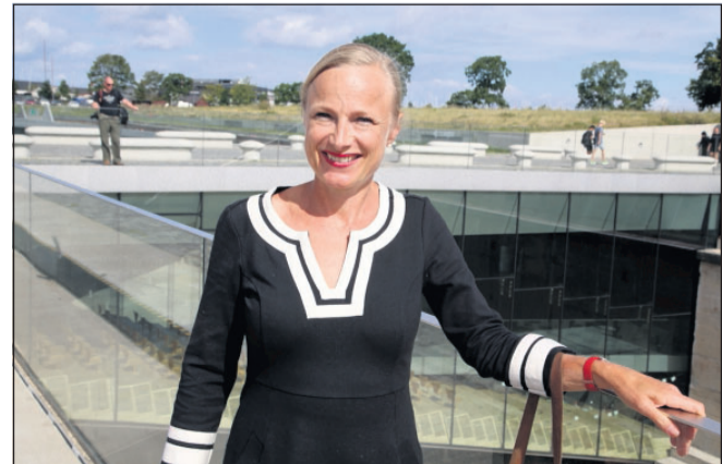
Direktør for M/S Museet for Søfart i Helsingør præsenterede i går for byrådspolitikerne sin del af visionerne og planerne for at få en samling af Nationalmuseets museumsskibe til Helsingør.

- De nye broer udformes som enkle træbroer, der placeres uden at berøre dokkens