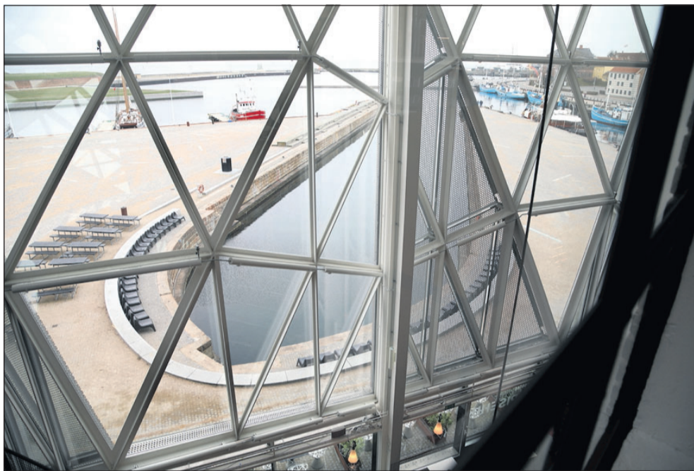
Dok 2, set opefra. I dag helt uden skibe. Med tiden efter al sandsynlighed fyldt med en enestående samling af museumsskibe.

I oplægget betoner man Kulturhavnens betydning, både som kulturhavn, og som aktiv og travl erhvervs- og handelshavn med indtjeningskrav.