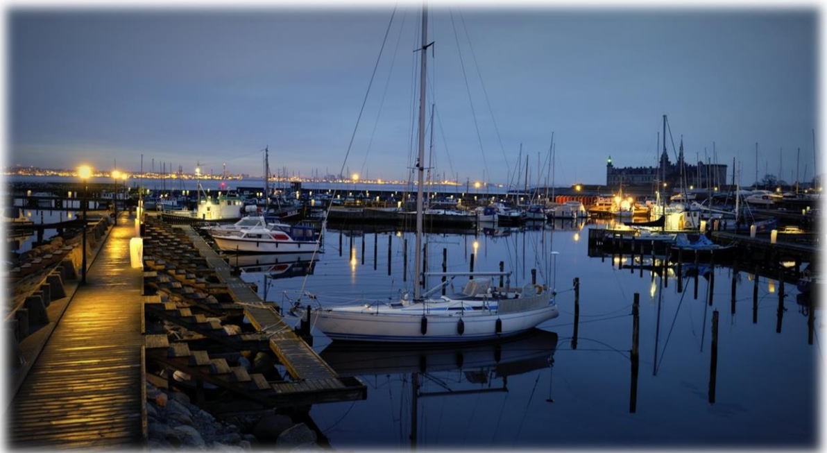
Godmorgen på Havnen

Vedtægter og Ordensregler for Helsingør Nordhavn